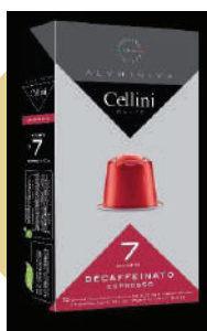
ALU CAFÉ DESK (CJ 10 X 10 CAPS) REF: 0703