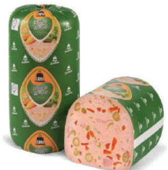
SEVILLANA DE PAVO (CJ 2U) REF: 0087