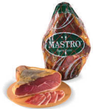
CENTRO JAMON DESHUESADO MASTRO (CJ 2U) REF: 0072