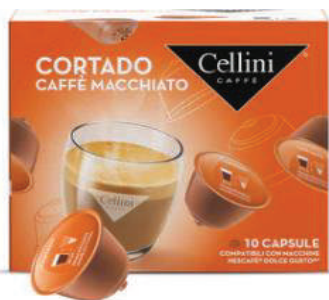
CAPS D/G CORTADO CAFÉ MACCHIATO (CJ 3 X 10 CAPS) REF: 0718