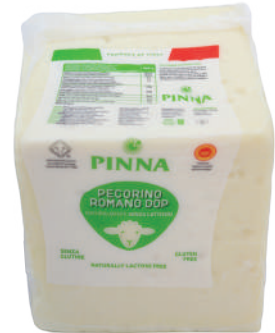
QUESO PECORINO ROMANO DOP - (CJ 1UND) REF: 0441 - 1/8 (CJ 8UND) REF: 0442