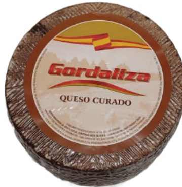
CURADO GORDALIZA (CJ 2U) REF:0195