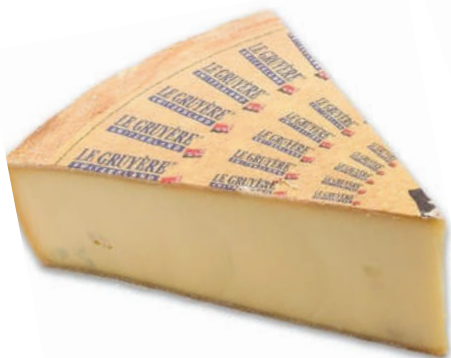
CUÑA GRUYERE SUIZO 1\8 (CJ 1U) REF:0257