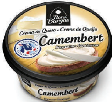
CREMA CAMEMBERT 125GR (CJ 8U) REF: 0206