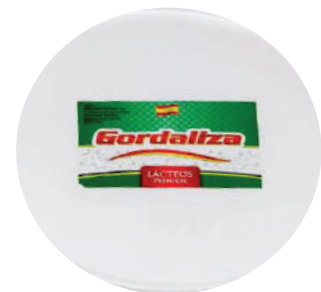
CREAM CHEDDAR 7,7LB (CJ 1U) REF:0203