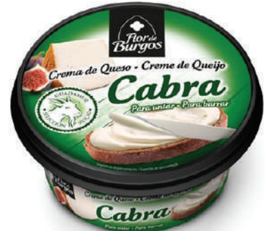
CREMA CABRA 125GR (CJ 8U) REF: 0205