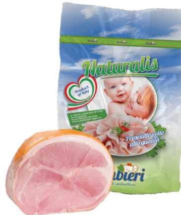
JAMON COCIDO ITALIANO (CJ 1UND) REF: 0601