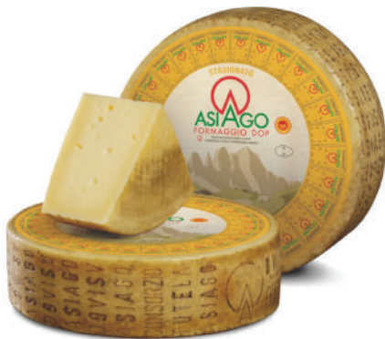
QUESO ASIAGO DOP 13KG APROX. (CJ 1U) REF: 0446