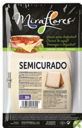
LONCHAS SEMICURADO 150GR (CJ 15U) REF:0327