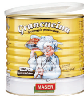
RALLADO FRESCO LATA 2.2LB (CJ 6U) REF: 0413