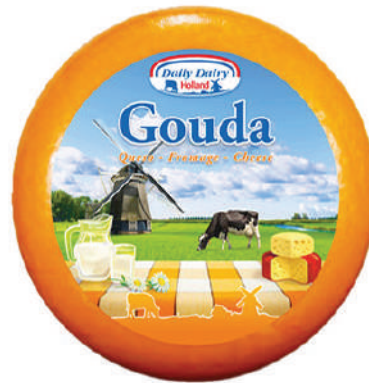
GOUDA PLATO GIGANTE (CJ 1U) REF:0137