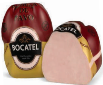
PECHUGA PAVO BOCATEL (AVE) (CJ 1U) REF: 0351