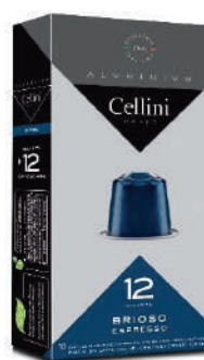
ALU CAFÉ BRIOSO (CJ 10 X 10 CAPS) REF: 0706