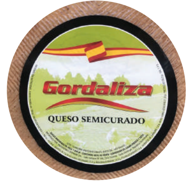
SEMICURADO (CJ 2U) REF:0194