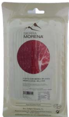
PALETA IBERICA SOBRES 100GR (CJ 24U) REF:0239