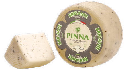
QUESO PECORINO CON TRUFA ITALIANO (CJ 3UND) REF: 0445