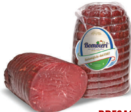
BRESAOLA (CJ 10UND) REF: 0623