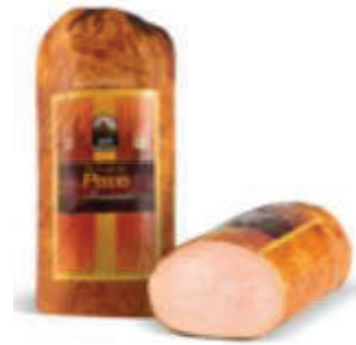
PECHUGA DE PAVO GRILL BRASEADA (CJ 2U) REF: 0064