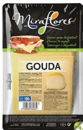
LONCHAS GOUDA 150GR (CJ 18U) REF:0326 LONCHAS GOUDA S/LACTOSA (CJ 18U) REF:0334