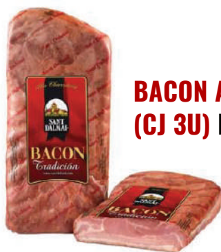
BACON ARTESANO (CJ 3U) REF:0051