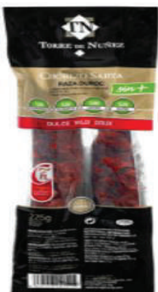
CHORIZO SARTA DULCE 225GR (CJ 20U) REF 0357