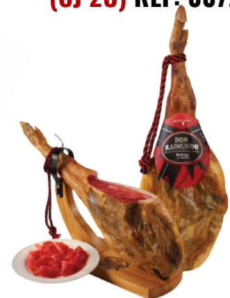
JAMON BODEGA C/P 12 MESES (CJ 2U) REF: 0071