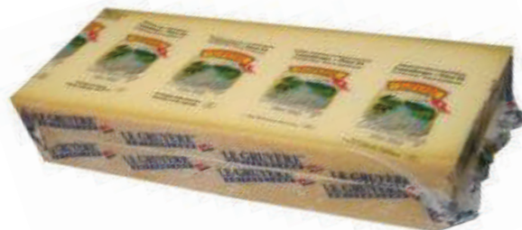
GRUYERE BLOQUE 5,5 LB (CJ 6U) REF:0019