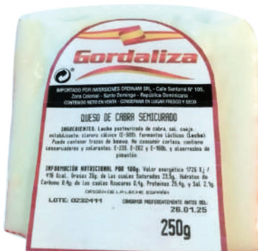
CUÑAS SEMICURADO DE CABRA GORDALIZA 250G (CJ 24U) REF:0269