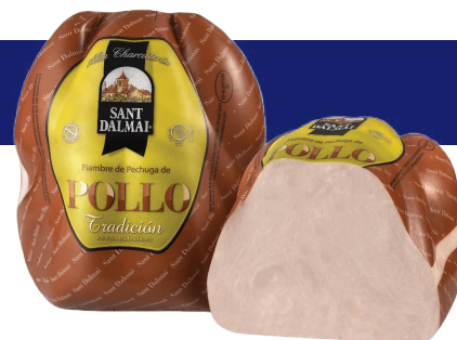
PECHUGA DE POLLO SANT DALMAI (CJ 1UND) REF: 0350