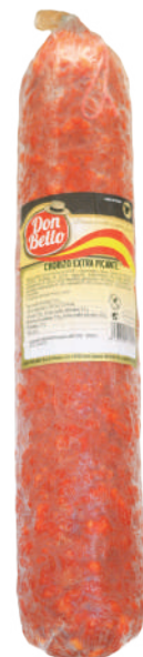
CHORIZO VELA REGIO (CJ 4U) REF:0359 (CJ 4U) REF:0396 PICANTE