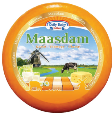
MAASDAM RUEDA (CJ 1U) REF:0011