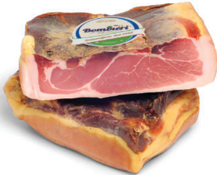
PROSCIUTTO DESHUESADO (CJ 4UND) REF: 0614