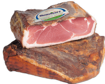
SPECK APENROSE SADRATO 1/2 (CJ 4UND) REF: 0615