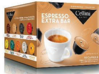
CAPS D/G ESPRESSO CAFÉ EXTRABAR (CJ 3 X 10 CAPS) REF: 0714