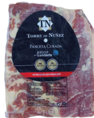
PANCETA CURADA NATURAL 1\2 (CJ 6U) REF:0355