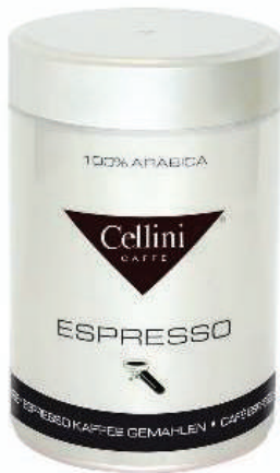
CAFÉ ESPRESSO 500 GRS TIN GROUND (CJ 1X 6 UND) REF: 0728