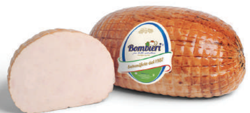
JAMON PAVO ITALIANO (CJ 4UND) REF: 0622