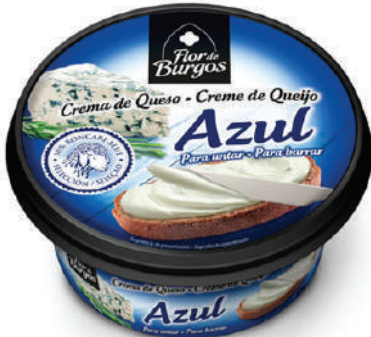
CREMA AZUL 125GR (CJ 8U) REF: 0207