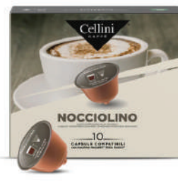
CAPS.D/G CAFÉ NOCCIOLINO (CJ 3 X 10 CAPS) REF: 021