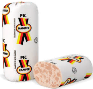
PIC KAMPER 6.6LB (CJ 2U) REF:0065