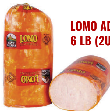
LOMO ADOBADO 6 LB (2UND) REF:0095