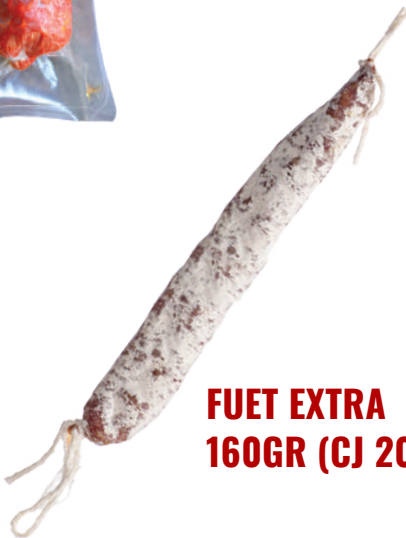
FUET EXTRA 160GR (CJ 20U) REF:0313