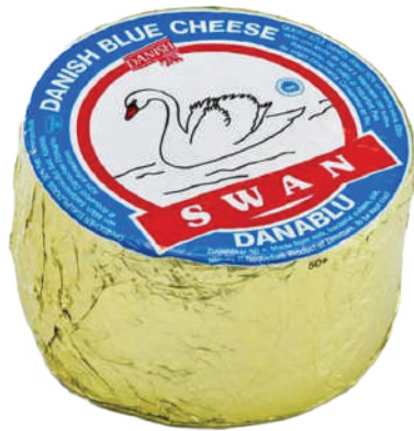
AZUL RUEDA (CJ 3U) REF:0020