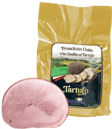
JAMON COCIDO ITA CON TRUFA (CJ 1UND) REF: 0600