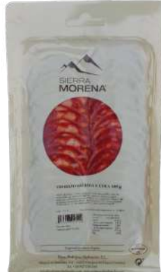
CHORIZO IBERICO SOBRES 100GR (CJ 24U) REF:0227