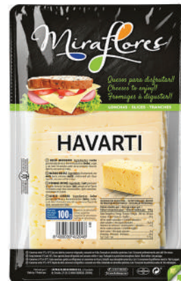
LONCHAS HAVARTI 150GR (CJ 18U) REF:0329