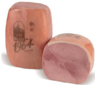
JAMON COCIDO RESERVA (CJ 1U) REF:0045