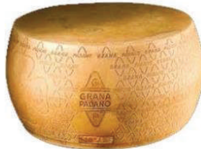
GRANA PADANO RUEDA 80LB (CJ 1U) REF: 0015