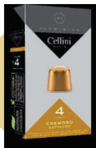
ALU CAFÉ CREMOSO (CJ 10 X 10 CAPS) REF: 0702