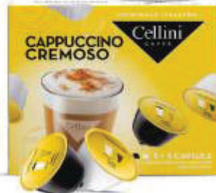
CAPS D/G CAFÉ CREMOSO (CJ 3 X 10 CAPS) REF: 0717