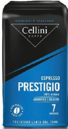
CAFÉ PRESTIGIO 250GRS BAG GROUND (CJ 1 X 10 UND) REF: 0724