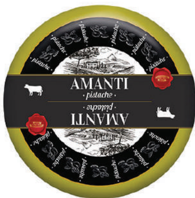
AMANTI GOUDA PISTACHO (CJ 1U) REF:0431