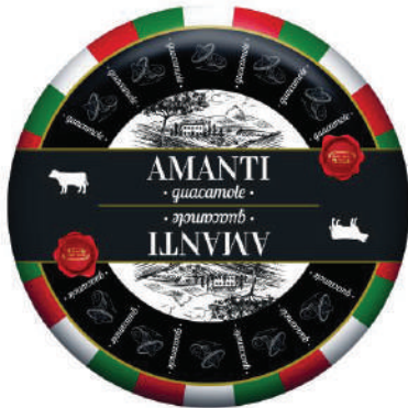
AMANTI GOUDA DE GUACAMOLE (CJ 1U) REF:0401