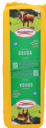
GOUDA BARRA (CJ 4U) REF:0237