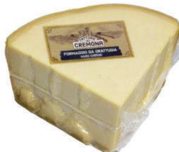
GRANA PADANO 9LB (CJ 4U) REF:0014