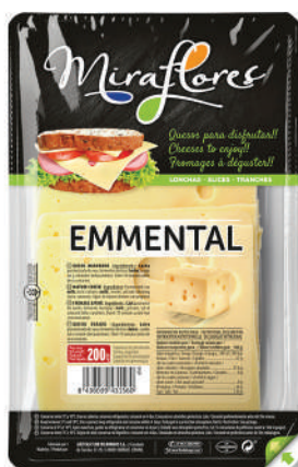
LONCHAS EMMENTAL 150GR (CJ 18U) REF:0331