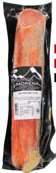
LOMO EMBUCHADO DUROC (CJ 10U) REF:0082