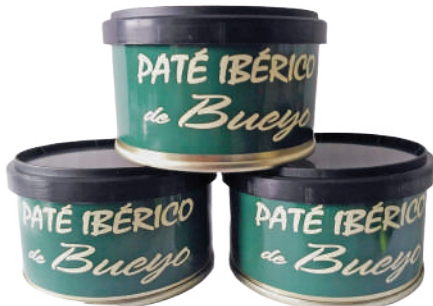
PATE IBERICO (CJ 33U) REF:0415