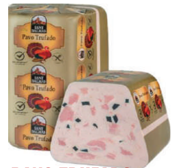
PAVO TRUFADO 8.8LB (CJ 1U) REF: 0175