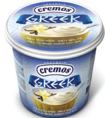
GRIEGO C/VAINILLA 650GR (CJ 6U) REF: 0162