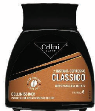
CAFÉ INSTANTANEO JARS 100 GRS (CJ 1X6 JARS) REF: 0723