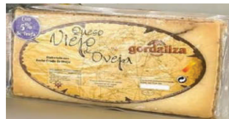
QUESO DE OVEJA MITADES CON ROMERO (CJ 4U) REF: 0391