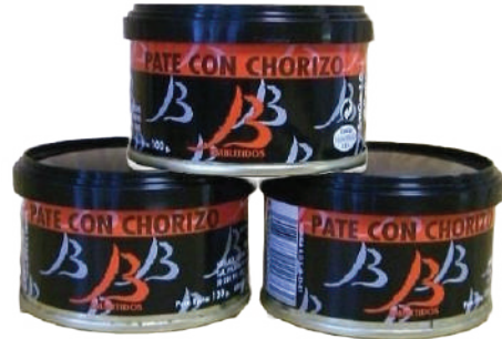
PATE CON CHORIZO (CJ 33U) REF:0414