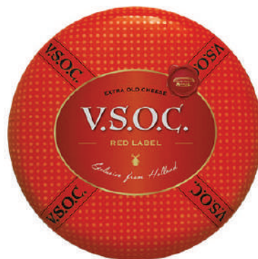
AMANTI V.S.O.C ETQ ROJA (CJ 1U) REF:0364