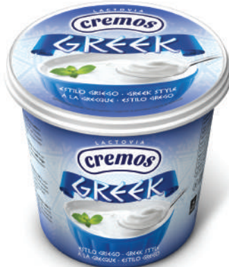
NATURAL GRIEGO 650GR (CJ 6U) REF: 0155