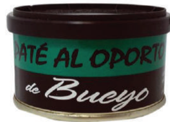
PATE AL OPORTO (CJ 33U) REF:0417