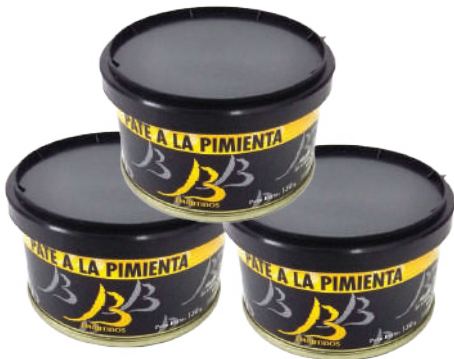
PATE A LA PIMIENTA (CJ 33U) REF:0418