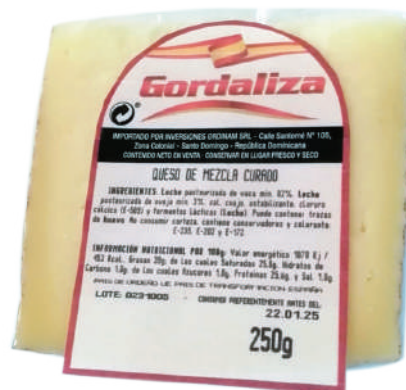
CUÑAS CURADO GORDALIZA 250G (CJ 24U) REF:0252