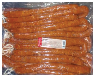
CHISTORRA BOLSA 7.8LB (CJ 3U) REF:0130