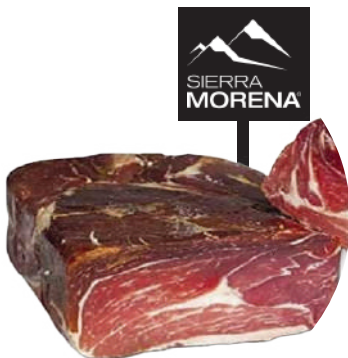
CENTRO JAMON DESHUESADO 1964 (ALTO RENDIMIENTO) (CJ 4U) REF: 0099