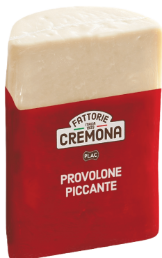
PROVOLONE PICCANTE (CJ 2UND) REF: 0308