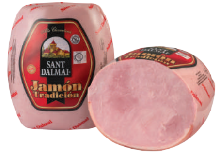
JAMON TRADICION 10LB (CJ 1U) REF:0408 16LB (CJ 1U) REF:0049