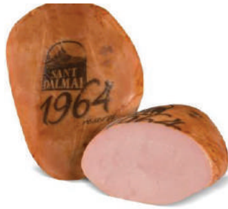
PECHUGA DE PAVO 1964 (CJ 2U) REF: 0054