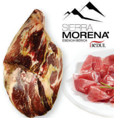
JAMON DESHUESADO SIERRA MORENA (CJ 2U) REF: 0198