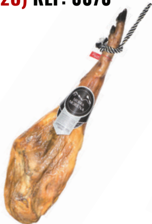
JAMON BODEGA C/P SIERRA MORENA (CJ 1U) REF: 0197