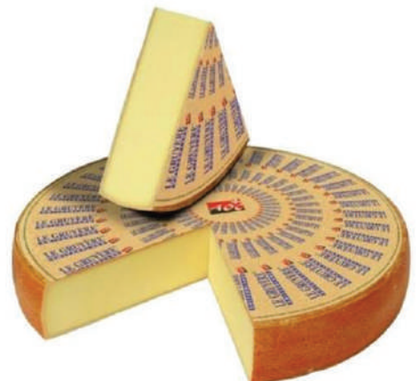
GRUYERE SUIZO RUEDA (CJ 1U) REF:0209