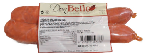
CHORIZO OREADO 280GRAMOS (CJ 24U) REF:0439