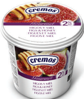
HIGOS Y MIEL 650GR (CJ 6U) REF: 0165