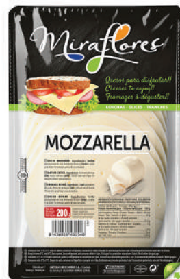
LONCHAS MOZZARELLA 150GR (CJ18U) REF:0328