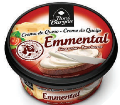
CREMA EMMENTAL 125GR (CJ 8U) REF: 0246