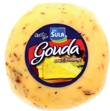
GOUDA CON COMINO (CJ 1U) REF:0007