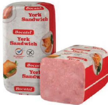
YORK SANDWICH 4X4 (CJ 2U) REF:0048