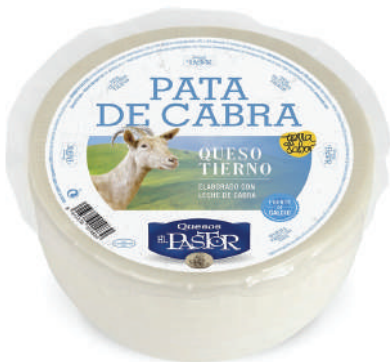
QUESO PURO DE CABRA TIERNO (CJ 2U) REF:0393