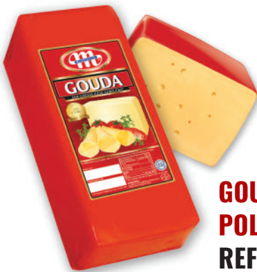
GOUDA BARRA POLONIA (CJ 5U) REF:0113