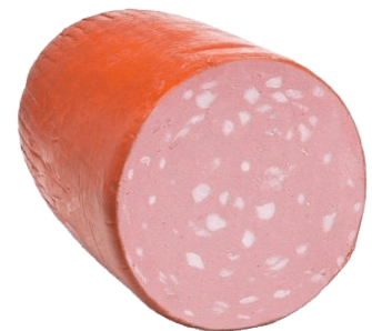
MORTADELA ITALIANA (CJ 4UND) REF: 0611