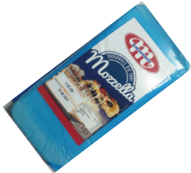
PIZZA CHEESE BARRA (CJ 5U) REF:0142