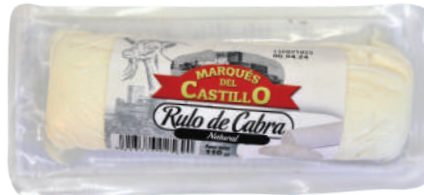
RULO DE CABRA MINI 110GR (CJ 8U) REF: 0013