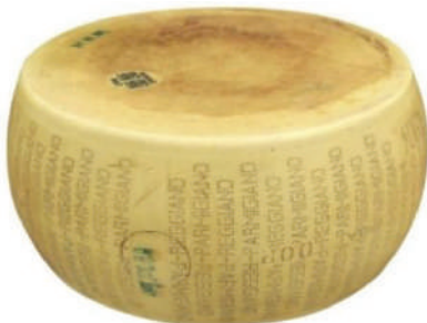
PARMIGIANO REGGIANO RUEDA (CJ 1U) REF:0397