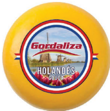
GOUDA PLATO (CJ 1U) REF:0005