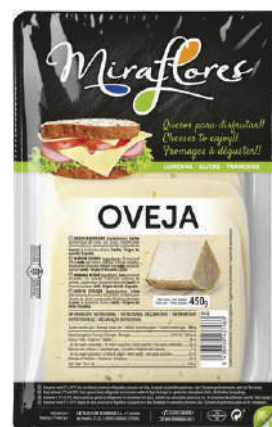
LONCHAS OVEJA (CJ 15U) REF:0332