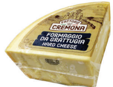
GRAN LEO 9LB (CJ 2U) REF:0140