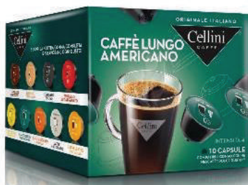
CAPS D/G CAFÉ LUNGO AMERICANO (CJ 3 X 10 CAPS) REF: 0716