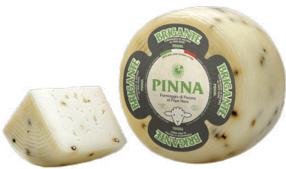
QUESO PECORINO PIMIENTA NEGRA (CJ 3UND) REF: 0443