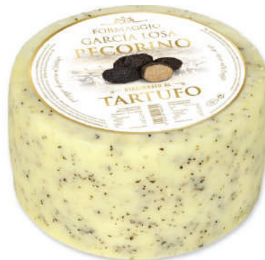
PECORINO CON TRUFA 5.6LB (CJ 1U) REF:0436