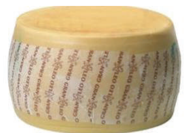
GRAN LEO RUEDA (CJ 1U) REF:0151