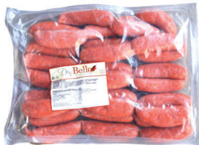
CHORIZO OREADO ATADO (CJ 3U) REF:0133