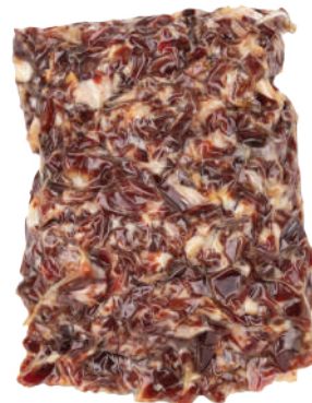
PICADILLO JAMON SERRANO 11 LB APROX (CJ 3U) REF 0371