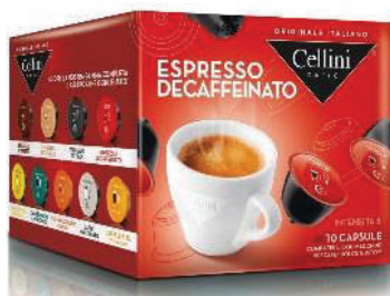
CAPS D/G ESPRESSO CAFÉ DESCAFF (CJ 3 X 10 CAPS) REF: 0715