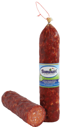
SALAMI NAPOLI PICANTE (CJ 8UND) REF: 0608