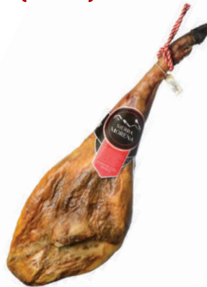
JAMON CEBO IBERICO C/P (CJ 1U) REF: 0225