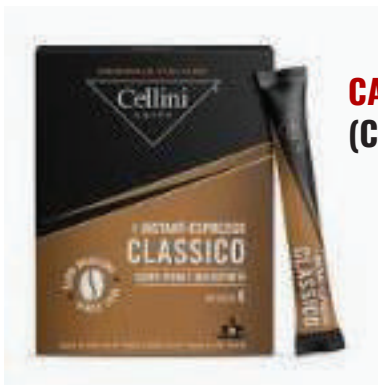
CAFÉ INSTANTANEO 20 STICKS (CJ 10UN) REF: 0722