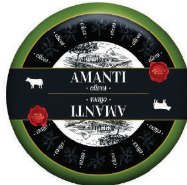
AMANTI GOUDA DE ACEITUNA (CJ 1U) REF:0402