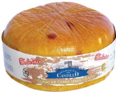
DELICIAS DE CABRA (CJ 2U) REF:0265