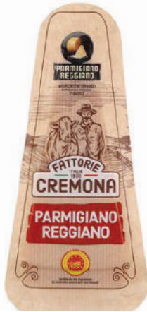
PARMIGIANO REGGIANO CUÑA 200GR (CJ 20U) REF:0427