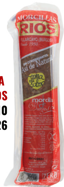
MORCILLA DE ARROZ BURGOS 320GR (CJ 15U) REF:0210 280GR (CJ 16U) REF:0426