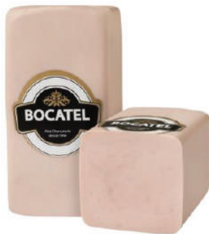
PAVO SANDWICH 4X4 (CJ 2U) REF: 0055