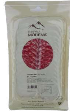
SALCHICHON IBERICO SOBRES 100GR (CJ 24U) REF:0228