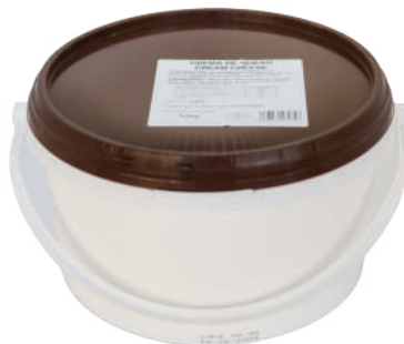
CREAM CHEESE 7,7LB (CJ 1U) REF:0241