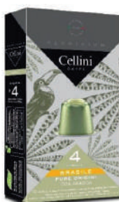
ALU CAFÉ BRASILE (CJ 10 X 10 CAPS) REF: 0707