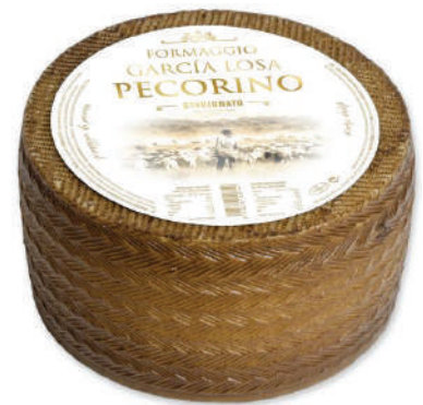
PECORINO PURO 6.6LB (CJ 2U) REF: 0435