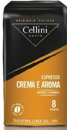
CAFÉ CREMA AROMA 250 GRS BAG GROUND (CJ 1 X 10 UND) REF: 0725