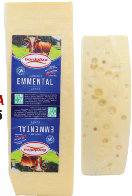
EMMENTAL BARRA (CJ 5U) REF: 0235