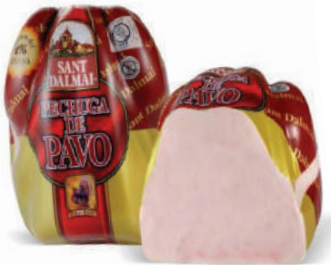
PECHUGA DE PAVO (6,6LB) (CJ 1U) REF: 0053