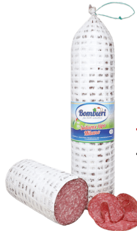
SALAMI GENOA ITALIANO - 1/2 (CJ 10UND) REF: 0606 - (CJ 5UND) REF: 0607