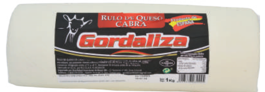
RULO DE CABRA 2.2 LB (CJ 2U) REF: 0044