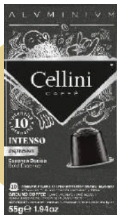
ALU CAFÉ INTENSO (CJ 10 X 10 CAPS) REF: 0700