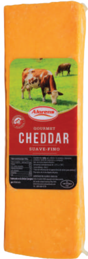
CHEDDAR BARRA (CJ 4U) REF:0424