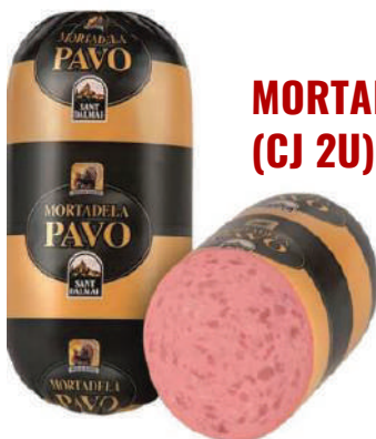
MORTADELA DE PAVO (CJ 2U) REF: 0056