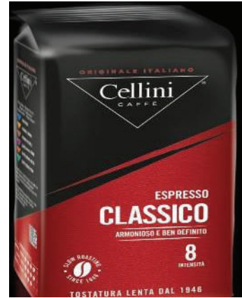
CAFÉ CLASSICO 250 GRS BAG GROUND (CJ 1 X 10 UND) REF: 0726