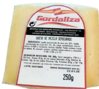
CUÑAS SEMICURADO GORDALIZA 250G (CJ 24U) REF:0253