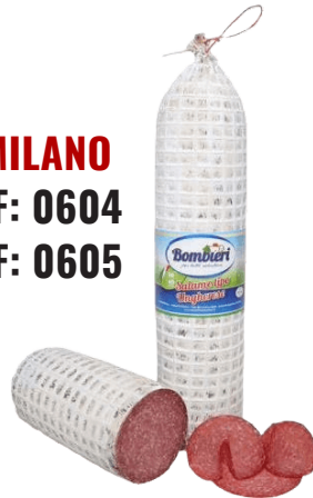
SALAMI MILANO - 1/2 (CJ 10UND) REF: 0604 (CJ 5UND) REF: 0605