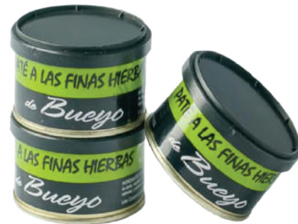
PATE A LAS FINAS HIERBAS (CJ 33U) REF:0420