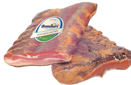
PANCETTA ITALIANA (CJ 10UND) REF: 0603