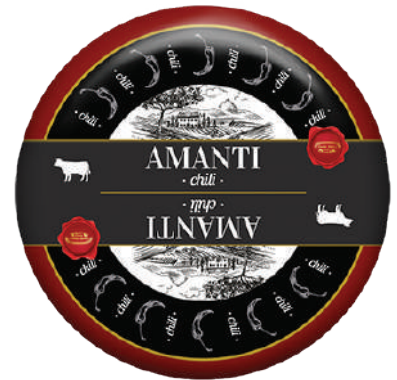
AMANTI GOUDA CHILI (CJ 1U) REF:0430