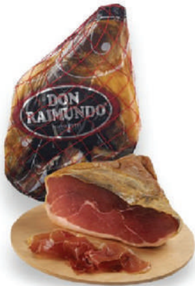
CENTRO JAMON IBERICO RESERVA DE CEBO 24 MESES (CJ 2U) REF: 0070