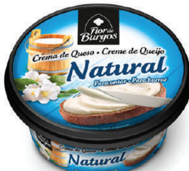
CREMA NATURAL 125GR (CJ 8U) REF: 0250