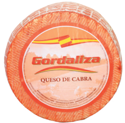
MANCHEGO DE CABRA GORDALIZA (CJ 2U) REF:0003