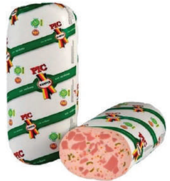
PIC KAMPER VERDURA (CJ 2U) REF:0409