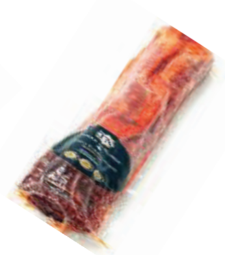
LOMO IBERICO 2.62 LB (CJ 12U) REF:0077