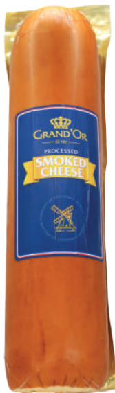
GOUDA AHUMADO (CJ 4U) REF:0406