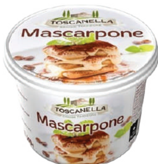
MASCARPONE TOSCANELLA 500GR (CJ 6U) REF: 0213