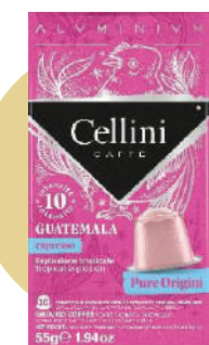
ALU CAFÉ GUATEMALA (CJ 10 X 10 CAPS) REF: 0708