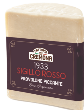
PROVOLONE SIGILLO ROSSO (CJ 2UND) REF: 0495