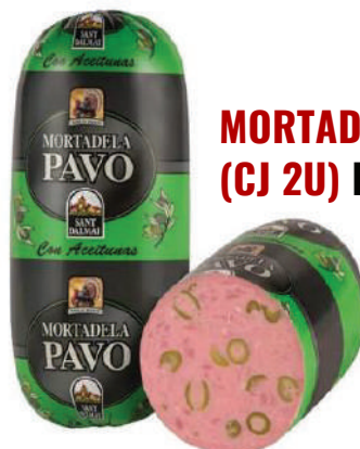
MORTADELA DE PAVO C/A (CJ 2U) REF: 0057