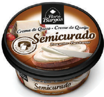
CREMA SEMICURADO 125GR (CJ 8U) REF: 0247