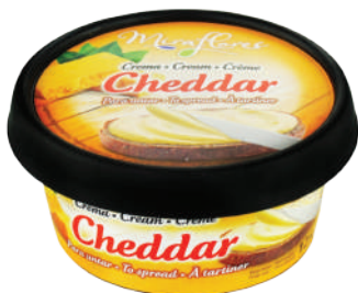
CREMA CHEDDAR 125GR (CJ 8U) REF: 0208