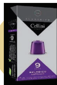
ALU CAFÉ MELODICO (CJ 10 X 10 CAPS) REF: 0701