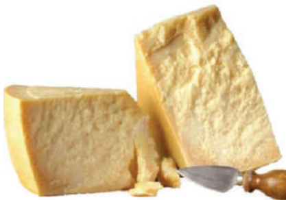
PARMIGIANO REGGIANO 1/8 (CJ 1U) REF:0398