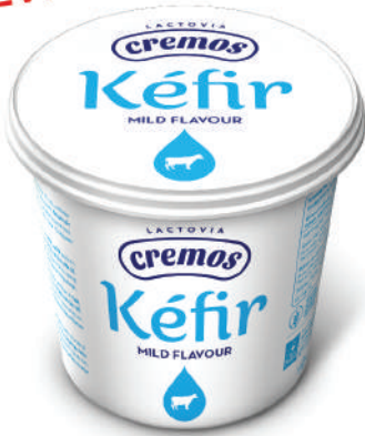
KEFIR 650GR (CJ 6U) REF:0211