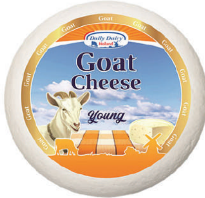
GOUDA CABRA TIERNO 10LB (CJ 1U) REF:0006