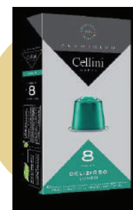
ALU CAFÉ DELIZIOSO (CJ 10 X 10 CAPS) REF: 0704