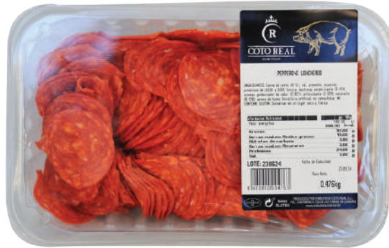
PEPPERONI LONCHEADO 500 GRAMOS (CJ 10U) REF:0092