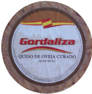
MANCHEGO DE OVEJA (CJ 2U) REF:0031