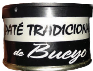
PATE TRADICION DE BUEYO (CJ 33U) REF:0416