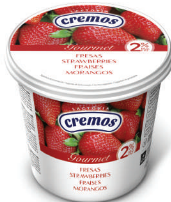
FRESAS 650GR (CJ 6U) REF: 0159