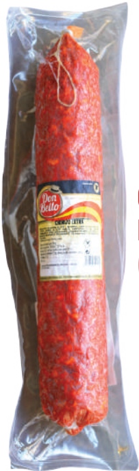
CHORIZO EXTRA PAMPLONA 4,3LB (CJ 2U) REF:0078