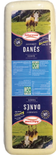
DANES BARRA (CJ 4U) REF:0093