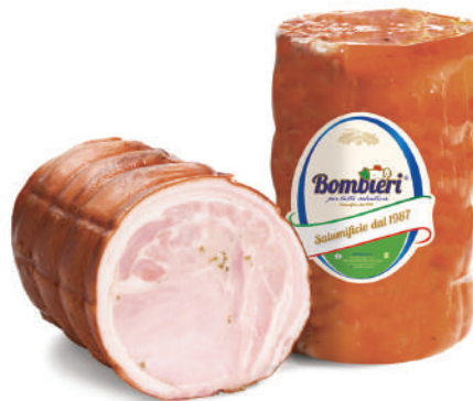
PORCHETTA (CJ 3UND) REF: 0617