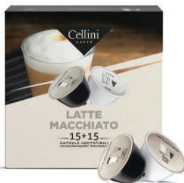
CAPS.D/G CAFÉ LATTE MACCHIATO (CJ 3 X 10 CAPS) REF: 0719