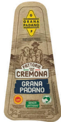
GRANA PADANO SIN LACTOSA 200GR (CJ 20U) REF: 0428