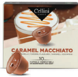
CAPS.D/G CAFÉ CAMELO MACCHIATO (CJ 3 X 10 CAPS) REF: 0720