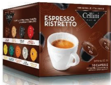
CAPS D/G ESPRESSO CAFÉ RISTRETT (CJ 3 X 10 CAPS) REF: 0712