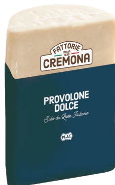
PROVOLONE DOLCE (CJ 2UND) REF: 0102