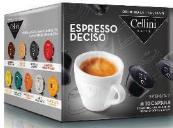
CAPS D/G ESPRESSO CAFÉ DECISO (CJ 3 X 10 CAPS) REF: 0713