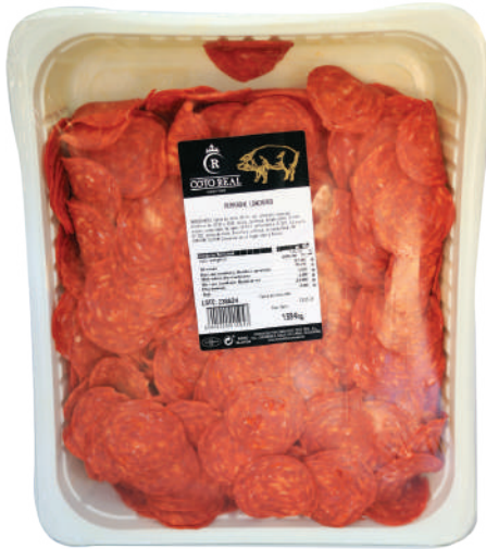
PEPPERONI LONCHEADO 3.3 LB (CJ 3U) REF:0145