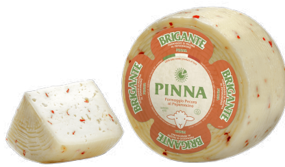
QUESO PECORINO PEPERONCINO (CJ 3UND) REF: 0444