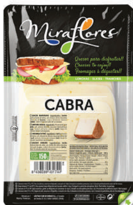
LONCHAS CABRA 150GR (CJ 15U) REF:0298