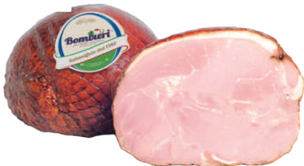
JAMON COCIDO ITA TIPO PRAGA (CJ 2UND) REF: 0621