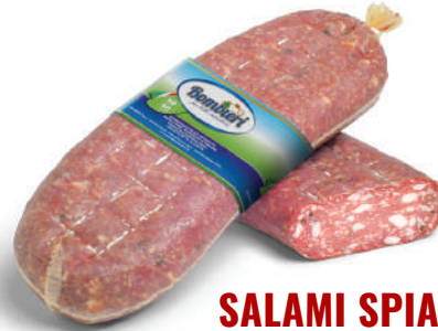
SALAMI SPIANATA DULCE (CJ 6UND) REF: 0619