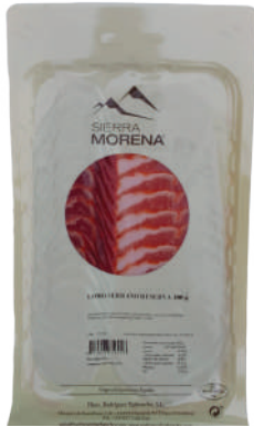
LOMO CURADO SOBRES 100GR (CJ 24U) REF:0226