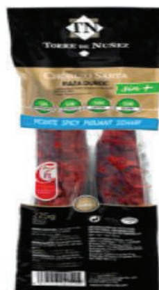
CHORIZO SARTA PICANTE 225GR (CJ 20U) REF:0358