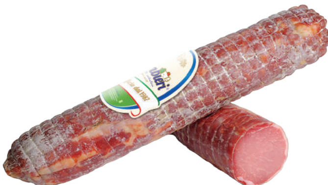
LOMO CURADO ITALIANO (CJ 8UND) REF: 0616