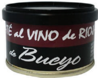
PATE AL VINO DE RIOJA (CJ 33U) REF:0419