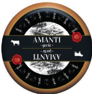
AMANTI GOUDA CON AJO (CJ 1U) REF:0403