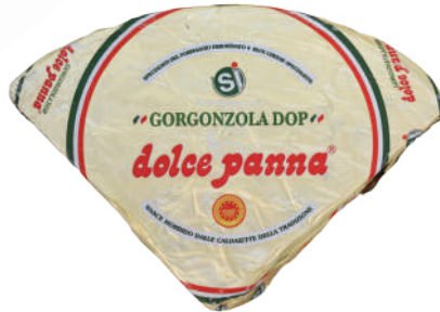
GORGONZOLA 1/8 (CJ 4UND) REF: 0018