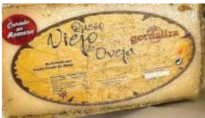
QUESO DE OVEJA MITADES CON TRUFA (CJ 4U) REF: 0392