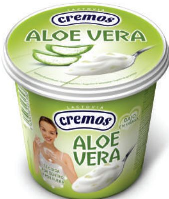
ALOE VERA 650GR (CJ 6U) REF: 0163