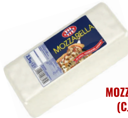
MOZZARELLA BARRA (CJ 4U) REF:0238