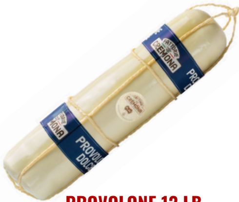
PROVOLONE 13 LB (CJ 2UND) REF: 0016