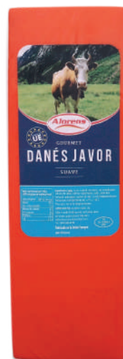
DANES JAVOR (CJ 5U) REF:0425