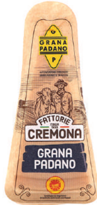
GRANA PADANO DO CUÑA 200GR (CJ 20U) REF: 0150