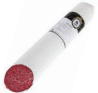
SALAMI GENOA 4.6LB (CJ 2U) REF:0088