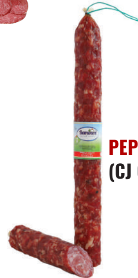
PEPPERONI ITALIANO (CJ 6UND) REF: 0610