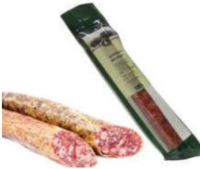
CHORIZO CULAR IBERICO 2,2 LB (CJ 6U) REF:0075