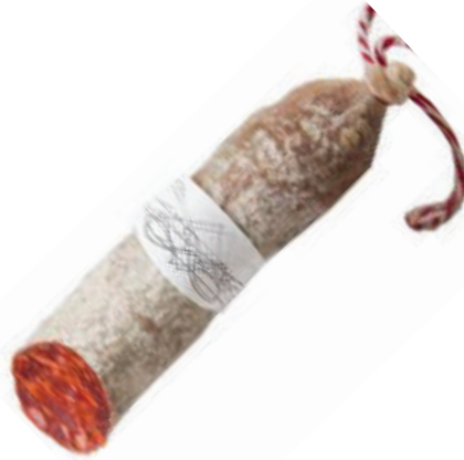
SALCHICHON CULAR IBERICO 2,2LB (CJ 6U) REF:0076