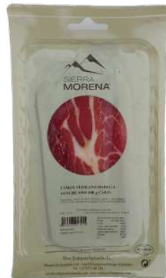
JAMON SERRANO SOBRES 100GR (CJ24U) REF:0089