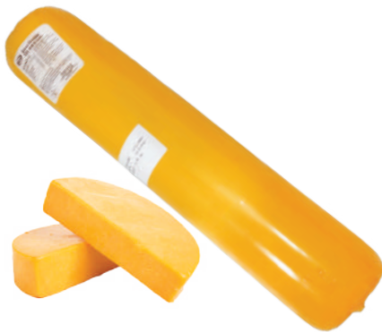
TIPO CHEDDAR AMERICANO CILINDRICO (CJ 3U) REF:0423