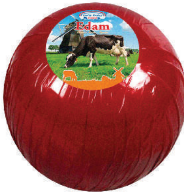
EDAM TIERNO BOLA (CJ 6U) REF:0009