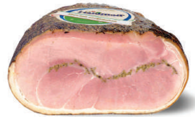
JAMON COCIDO ITA FINAS HIERBAS (CJ 2UND) REF: 0620