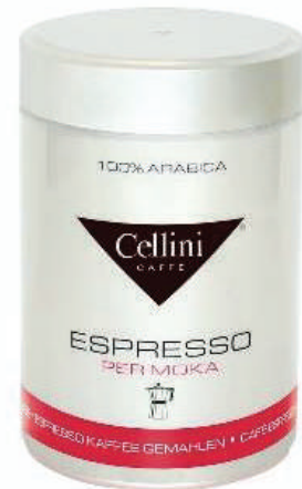
CAFÉ PREMIUM MOKA 250GRS TIN GROUND (CJ 1X 6 UND) REF: 0727