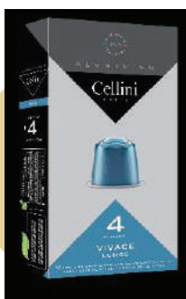
ALU CAFÉ VIVACE (CJ 10 X 10 CAPS) REF: 0705