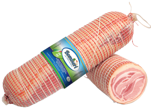
PANCETTA ENROLLADA DULCE ITALIANA (CJ 8UND) REF: 0602