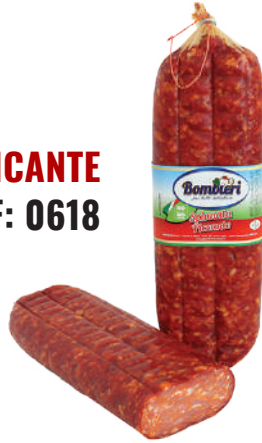
SALAMI SPIANATA PICANTE (CJ 6UND) REF: 0618