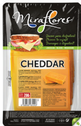
LONCHAS CHEDDAR 150GR (CJ 18U) REF:0325