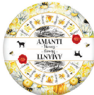
AMANTI GOUDA CABRA C/MIEL (CJ 1U) REF:0432