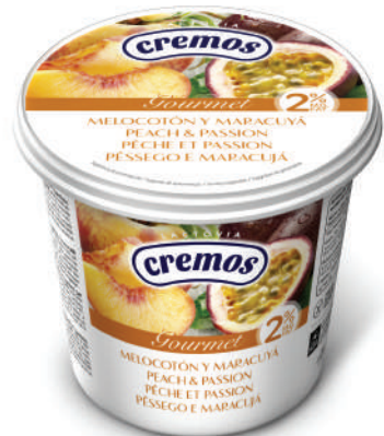
MELOCOTON MARACUYA 650GR (CJ 6U) REF: 0160