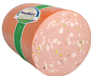
MORTADELA C/PISTACHOS 6.6LB - (CJ 4UND) REF: 0612 MORTADELA C/PISTACHOS 15.2LB - (CJ 1UND) REF: 0613